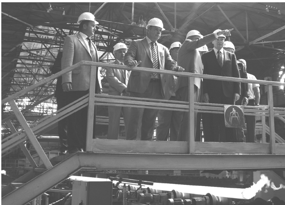
● Василий Голубев на открытии новой производственной линии завода TAGMET

– Нужно предлагать людям альтернативу. Поголовье свиней изымается, но есть возможности перепрофилировать и сохранить хозяйства, – подчеркнул Василий Голубев. – Сейчас в минсельхозе РФ активно обсуждают эффективность поддержки молочного животноводства. Мы должны эту поддержку для области сохранить.